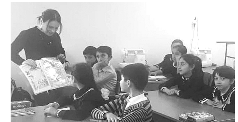
Фото № 1. В Доме детского творчества легко можно найти занятие по интересам. Многие ребята с удовольствием посещают кружок «Юный журналист» (руководитель – Н.Шавлохова).

Обязательно смотрите презентацию к игре, которую собираетесь купить. Убедитесь, что в ней нет насилия, чрезмерной жестокости, а также эротических