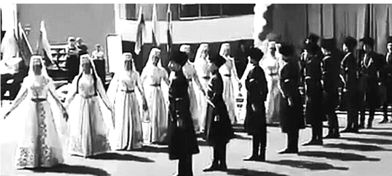
Фото № 2. Ансамбль народного танца ГДК «Бонвэрнон» из года в год растит поколения юных танцоров

Главное – индивидуальный подход, при котором учитывается характер и интересы маленького «геймера». Помимо пользы, есть и вред от компью-